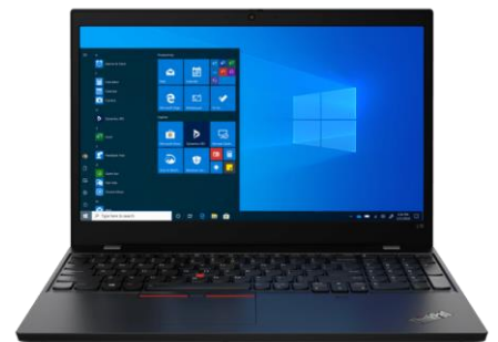
Afbeelding website Lenovo