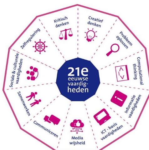
Het model voor 21e eeuwse vaardigheden zoals het is ontwikkeld door SLO en Kennisnet

Het gebruik van laptops biedt hiervoor heel wat extra mogelijkheden en kansen om de didactische doelen binnen de verschillende leerplannen te behalen. Daarnaast kan het ook helpen om belangrijke stappen te genereren in de ontwikkeling van de vaardigheden van de 21 ste eeuw .